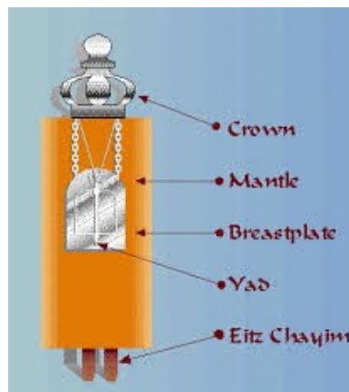
Figura 2. La Tôrāh ‘ revestida ’

cristianos de la iglesia primitiva la letra tav representaba el crucifijo 37 mientras la `aleph representa el origen , el único y por lo tanto, de manera traducida, el unigénito . Pues, para un conocedor de las Escrituras, ver al ‘ Unigénito Crucificado ’ fue sin duda un signo elocuente. Que el Crucificado fuera envuelto en una Sábana también hablaba claramente, basta pensar en la abreviatura תס Sefer Tôrāh 38 que indica los Libros de la Ley . La letra samekh ס , de hecho, tiene también el significado gráfico de enrollar como un rollo de la ley que tiene que ser desenrollado para ser leído y luego envuelto 39 . Así que la envoltura de Cristo crucificado en una Sábana visiblemente hacía presente a los primeros cristianos el cumplimiento de las Escrituras, como Él es la Palabra hecha carne. Interesante la siguiente imagen 40 que representa la Tôrāh ‘ revestida ’ (cómo se coloca dentro del `Aron o se lleva en procesión en la solemnidades y por ejemplo en la fiesta de Simchàt Tôrāh ) si se pone la huella de la Sábana Santa junto a su lado.